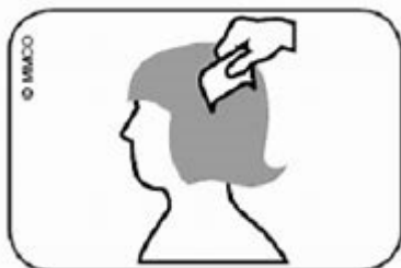
Abb. Durchkämmen des nassen Haares mit Lauskamm: vom Haaransatz bis zu den Haarspitzen